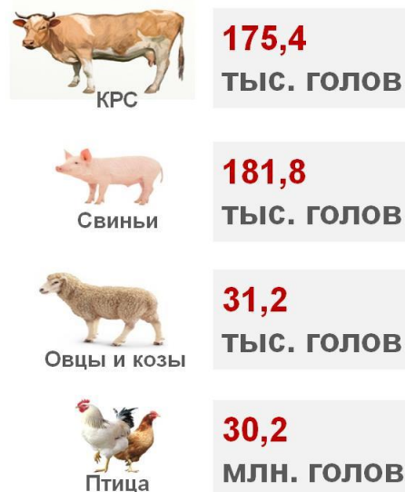
Поголовье на конец 2020 года