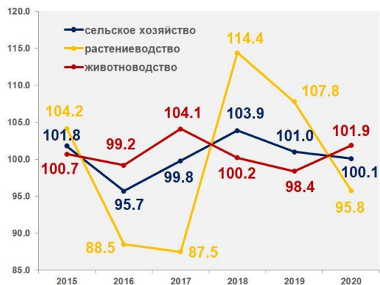
Индекс продукции сельского хозяйства в % к предыдущему году