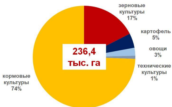
Структура посевной площади в 2020 году