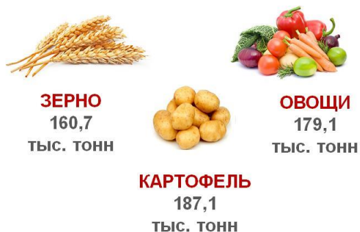
Валовые сборы в 2020 году